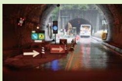
トンネル工事や屋内工事など