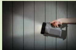
停電時のバックアップ電源に