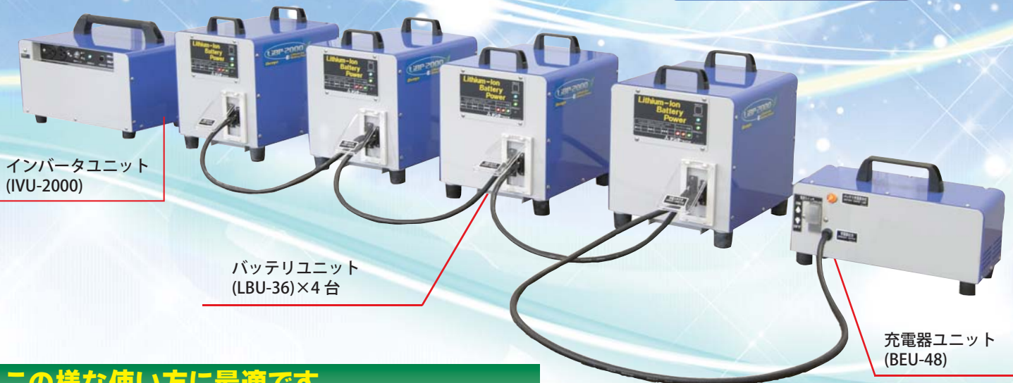
インバータユニット (IVU-2000)