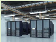
サーバーームのメンテナンスに