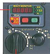
ワンタッチダイヤル