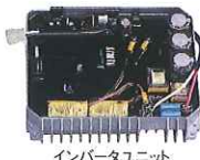
インバータユニット

接続された電気機器の負荷に応じてエンジン回転数を自動設定するオートパワーセーブ機能を装備しています。