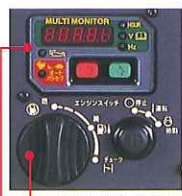
ワンタッチダイヤルマルチモニター

操作パネルを片面に集中させ、ワンダイヤルで燃料コック・運転スイッチ・チョーク機構を操作ができるようにしました。そのため、燃料コックの閉め忘れやチョークの戻し忘れを防止。また、オイル警告灯や電子ブレーカーなどを装備し操作性や安全性を高めました。