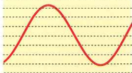
周波数変動率:1.0以下 無負荷波形歪率:2.5%

インバータ制御により、周波数変動率1.0%以下、波形歪率2.5%以下と家庭用の電源とほぼ同等の高品質な電源を実現しました。これにより、野外などさまざまなシーンでもパソコンをはじめ、精密機械や電子機器などを安心してご使用になれます。