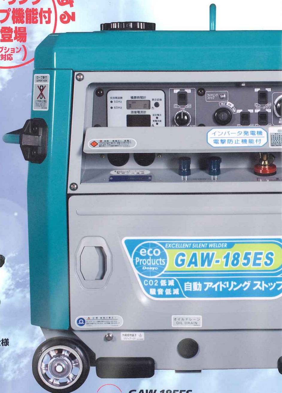
NEW GAW-185ES 自動アイドリングストップ仕様