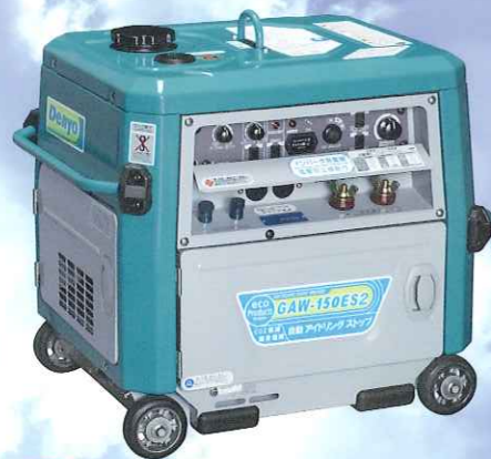
NEW GAW-150ES2 自動アイドリングストップ仕様