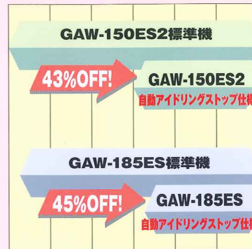
燃料消費量/CO2排出量

1日の現場作業(運転)の中で、作業員1人当たりの溶接関連作業時間を40%(3.2h)、溶接関連以外の作業を60%(4.8h)とし、溶接関連作業時間(3.2h)の内、実際の溶接時間を40%(アークタイム:1.28h)と仮定します。また、溶接中以外に単独で100Vコンセントを使用して、電動工具作業をする時間を1時間とすると、8時間-1.28時間-1時間=5.72時間が無駄な無負荷アイドリング運転をしていることとなります。*ガソリン129円/L CO2発生量 2.62kg/Lの場合